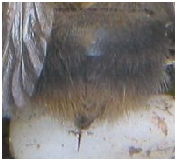
Angel van de akkerhommelmel

Een hommelmel heeft een groot lichaam maar relatief kleine vleugeltjes. Met de wetten van de aerodynamica kon men lange tijd niet verklaren dat een hommelmel kan vliegen. Na onderzoek bleek dat hommels een trucje hebben uitgevonden waardoor ze toch kunnen opstijgen. Door de op- en neergaande beweging van de vleugels ontstaan luchtwervelingen die zorgen voor een opwaartse kracht waardoor de hommelmel, hoewel hij eigenlijk te zwaar is, toch kan vliegen. Hommels halen dus extra energie uit de manier waarop de vleugels bewegen, en dit fenomeen wordt in de aerodynamica diepgaand bestudeerd om er voordeel uit te halen.